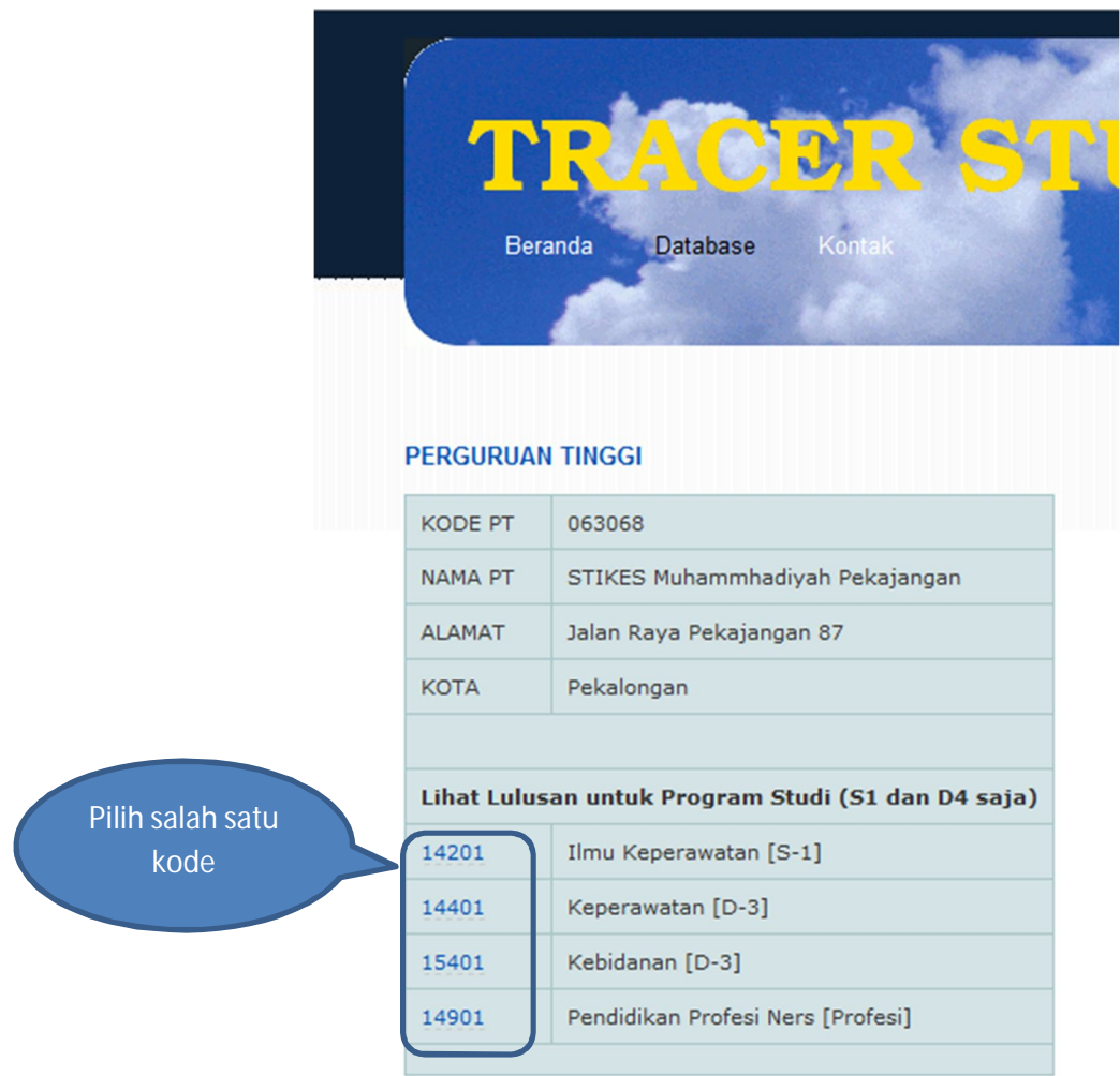
Gambar 3 Pemilihan Program Studi

6. Pilih Program Studi pada kode yang berwarna biru