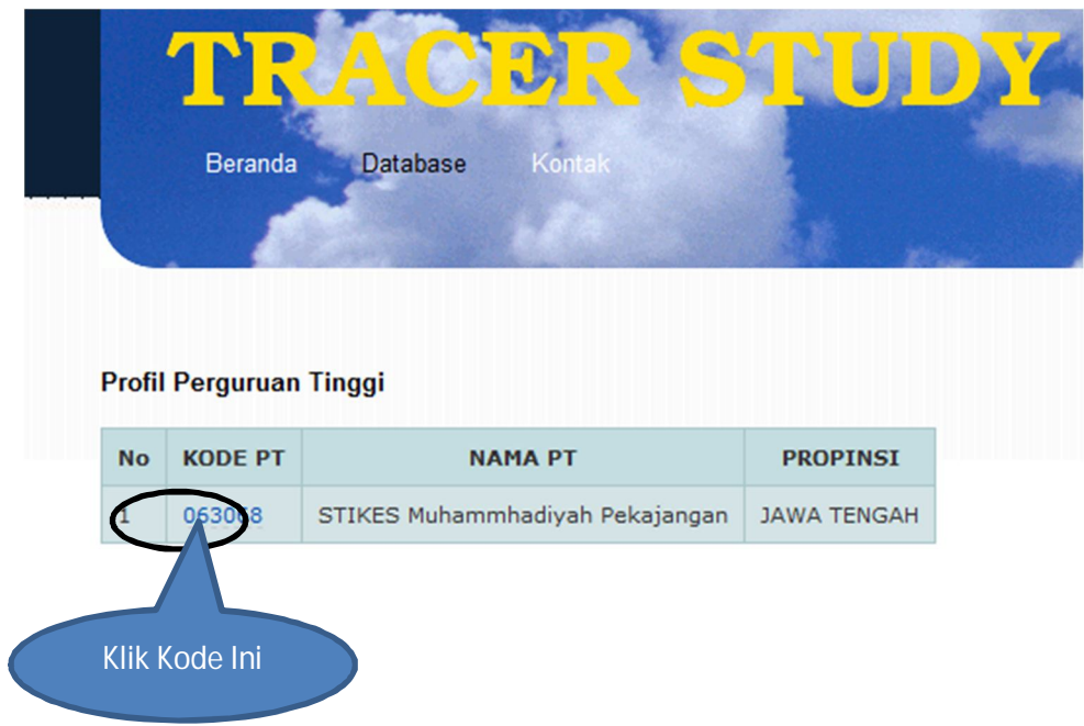
Gambar 2 Tampilan Hasil Pencarian Perguruan Tinggi

5. Pilih Kode PT seperti gambar dibawah ini